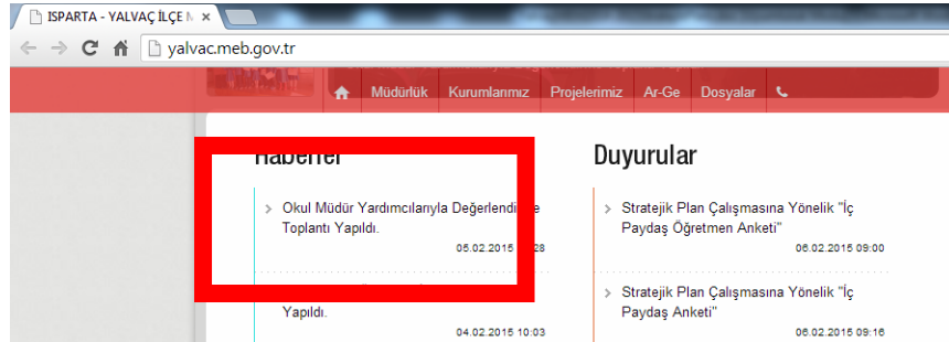
Resmi İnternet Sitemizden Anket Çalışmamızın Duyurusu Ekran Görüntüsü

2015–2019 yıllarını kapsayacak Müdürlüğümüz Stratejik Plan çalışmalarına ışık tutması için iç paydaşlarımız, dış paydaşlarımız , İlçe Milli Eğitim Müdürlüğü Çalışanlarımız ve Öğretmenlerimiz için elektronik ortamda anket oluşturulmuş ve bu anket İlçe Milli Eğitim Müdürlüğümüz Resmi İnternet Sitemiz aracılığı ile gerçekleştirilmiş ,paydaş görüşleri plana dâhil edilmiştir.