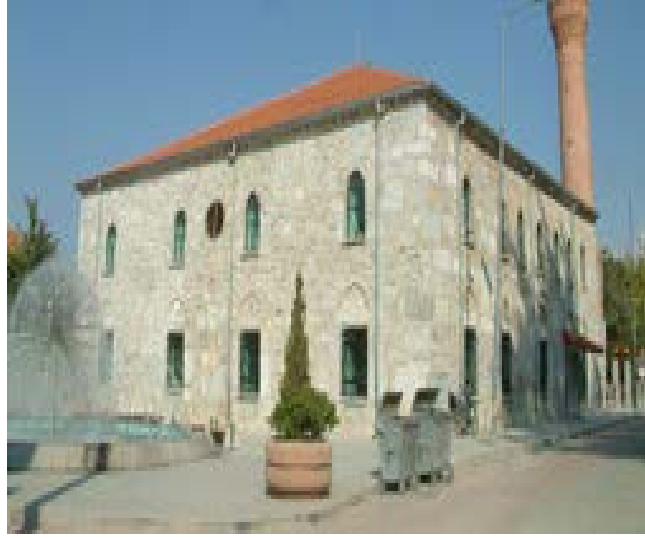
Fotoğraf 5:Selçuklu eseri olan Devlethan Camiinden günümüzden bir kesit

Osmanlılar döneminde tüm Anadolu'da uygarlık üst düzeyde olduğundan Yalvaç'ta bu dönemde inşa edilen cami, han, hamam, ve sivil mimari örneklerine bugünde rastlamak mümkündür.Bundan sonra Isparta ve çevresi ile birlikte Hamit Sancağı adı ile Konya'ya, daha sonra Isparta Sancağı vasıtasıyla Bursa'ya, 1840 yılında kaza haline geldikten sonra yeniden Konya'ya bağlanmıştır.