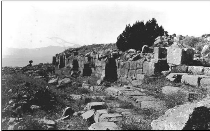
Fotoğraf 2: İlçenin kuzeyinde yer alan Antiokheia tarihi kentinden bir kesit

İ.Ö.2.YY.'dan itibaren, Avrupa'nın en güçlü devleti haline gelen Roma İmparatorluğu doğuya doğru ilerleyerek Anadolu'ya girer.Trakya'dan başlayarak Çanakkale Boğazından Magnesia, Psidia ve frigya'ya kadar uzanır. Kent, en parlak dönemini Roma egemenliğinde yaşar, bu dönemde yoğun imar faaliyetleri görülür. Kent imarı sırasında aynı Roma kentinde olduğu gibi 7 tepe üzerinde kurulmuş,7 mahalleye bölünmüştür.İ.S. 3. YY. sonlarına dek resmi dil Latince'dir.Bugün kenti gezerken görebileceğimiz yapıların büyük bir kısmı da Roma döneminde yapılan yoğun imar faaliyetlerinden günümüze kalanlardır.