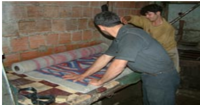
Fotoğraf 7:Geleneksel el sanatlarımızdan Keçecilik ve keçe atölyesinden bir kesit

Yalvaç,uzun yıllardan beri Türkiye'nin dericilik merkezlerinden biridir ve Türkiye'nin ilk deri işleme şirketlerinden biri de burada kurulmuştur. Yalvaç'ta işlenen deriler ülkenin muhtelif yerlerinde büyük alıcı potansiyeline sahiptir. Derici esnafı ata mesleklerini yürütürken,bilimsel metotlar yanında kendi irade güçlerine,meslek sevgilerine,bu sanatı kendinden sonraki kuşaklara aktarma gayretlerine güvenirlir. Dericilik çalışmaları yanında çırçır topu imalatı da yapılır.