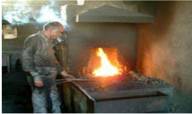
Fotoğraf 9:Geleneksel el sanatlarımızdan demircilik ve demir atölyesinden bir kesit

Binek hayvanlarının sırtına vurulan semer yapımı da Yalvaç'ta bir işkoludur. Ulaşımın elverişli olmadığı patika yollarda, sırtına semer vurduğu hayvanına binmek, heybesine koyduğu eşyayı götürmek, Yalvaç'ın kırsal kesim insanını son model arabaya binmekten daha mutlu eder. Ne yazık ki, bu sanatla uğraşanlar da gün geçtikçe azalmaktadır.