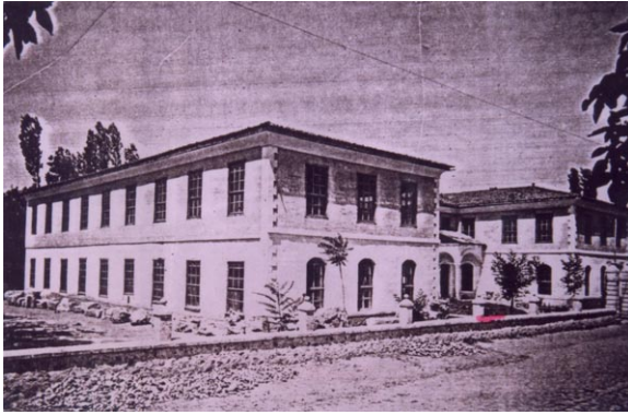
Eski Hükümet Konağı Binası

İlk olarak 1 Müdür ve 1 Şube Müdürü ile eski Hükümet Konağının zemin katında çalışmalarına başlamıştır. En son olarak 1 Müdür ve 4 şube müdürü ile Yeni Hükümet Konağı 3. Katının bir bölümünde çalışmalarına devam etmektedir.