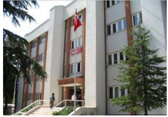
Yeni Hükümet Konağı Binası

4+4+4 sürecine geçilme aşamasında merkez ,köy ve kasabalarımızın tamamının okul ve derslik ihtiyaçları yeniden yapılandırılmıştır. İlçemize Turizm Otelcilik Meslek Lisesi ve Uygulama Oteli , YBO Sağlık Meslek Lisesi, Anadolu Liseleri ve Fen Lisesi gibi seçkin eğitim kurumları ilçemize kazandırılmıştır. Ayrıca merkezde okullar yeni sisteme göre ilk ve ortaokul olarak yeniden düzenlenmiştir. Kurum Hükümet konağı 3. Katının bir bölümünde 1 Müdür, 4 Şube Müdürü, 4 Şef, 4 VHKİ, 1 Memur, 1 Şoför, 6 hizmetli, 5 Daimi işçi ile çalışmalarını sürdürmektedir. Yalvaç İlçe Milli Eğitim Müdürlüğüne Bağlı ,34 İlkokul ,20 ortaokul,9 ortaöğretim, 1 Halk Eğitim Merkezi, 1 Mesleki Eğitim Merkezi, 1 Öğretmeni ve ASO, 1 Uygulama Oteli, 1 Anaokulu , 1 Özel Uygulamalı İş Okulu, 1 Özel Eğitim ve Rehabilitasyon Merkezi, 3 Sürücü Kursu,ve 9 Özel Yurt bulunmaktadır.