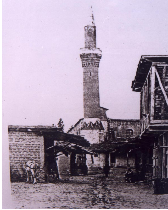
Fotoğraf 4: Selçuklu eseri olan Devlethan Camiinden eski bir kesit

Kentin önemini fark eden Aziz Paulus İ.S. 46 ve 62 yılları arasında Antiocheia'ya 3 kez gelerek Hristiyanlığın temelini burada atmıştır. Özellikle İ.Ö.4.yy.'ın başlarında Hristiyanlığın serbest bırakılmasıyla Bizans döneminde de dini bir merkez olarak önemini sürdürmüştür.