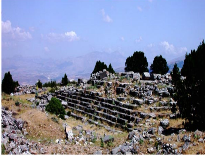
Fotoğraf 1: İlçenin kuzeyinde yer alan Antiokheia tarihi kentinden bir kesit

tarihi ise İ.Ö.3 Bin yılların Helenistik Krallıklardan Seleukid hanedanı ile başlar. İskender'in ölümünden sonra Anadolu'da devam eden paylaşımlar sonunda Psidia bölgesi I.Seleukos Nikator'un eline geçer. Antiocheia kenti İ.Ö.275 tarihinde I.Antiochos soter'in dedesi ve kendi adı olan Antiochos'u kente vermesiyle tarih sahnesine çıkar. Ancak kentin yakınındaki Men Kutsal Alanı buluntularının İ.Ö.4. YY.'a kadar ulaşmış olması bölgede bir Klasik Dönem Kültürünün olduğunu gösterir.