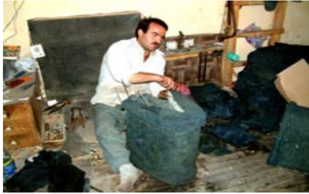
Fotoğraf 8:Geleneksel el sanatlarımızdan semercilik ve semer atölyesinden bir kesit

Sayıları gün geçtikçe azalan keçeci esnafı, saf yünden yaptığı keçeye alın terini, emeğini nakış nakış renk renk işler. Bu sanata bağlantılı olarak yapılan kepenekler de ünlüdür. Saf yünden kepenegi sırtına alan çoban, soğuklara meydan okur.