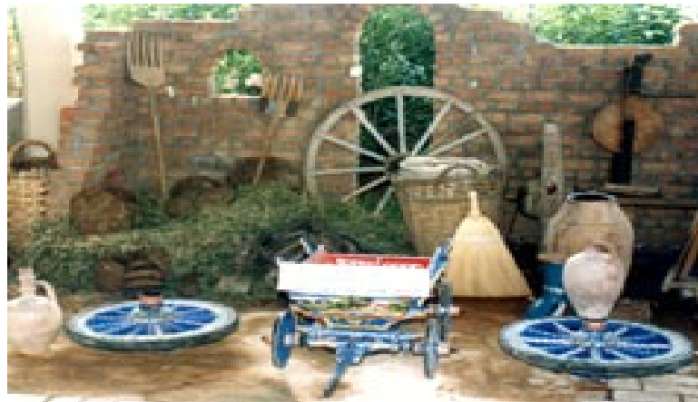
Fotoğraf 10:Geleneksel el sanatlarımızdan at arabacılığı ve at arabacılığı atölyesinden bir kesit

Türk insanı, bakır işletmeciliği deyince Erzincan'ı, Kahramanmaraş'ı hatırlar. Oysa, Yalvaç'ta bakır işlemeciliği uzun yıllardır sürmektedir. "Bakırcılar Arastası" denilen mevkideki esnaf geleneksel yöntemleriyle bakırı işlerler. Bu ustaların el emeği, göz nuruyla bezedikleri, güğüm, semaver gibi bakır eşyalar, çeyizlerin vazgeçilmez parçalarıdır.