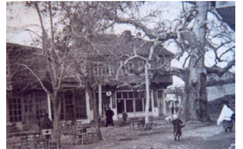
Yalvaçtan Tarihi Kareler